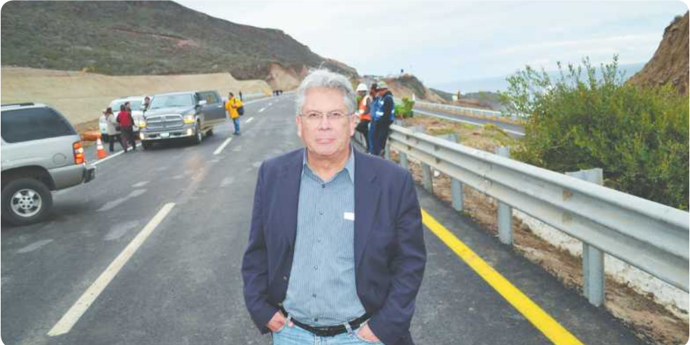
La pérdida de vidas humanas y materiales han sido inmensas, dijo, 15 personas fallecidas y millones de dólares han afectado moral y económicamente a los residentes de toda la región por la falta de flujo comercial y turístico.

No obstante, manifestó, las autoridades están en deuda con la comunidad y más con los deudos de las víctimas fatales por los accidentes ocurridos en la Carretera Libre, la cual es impagable, pero con la cual nos solidarizamos como seres humanos que somos.