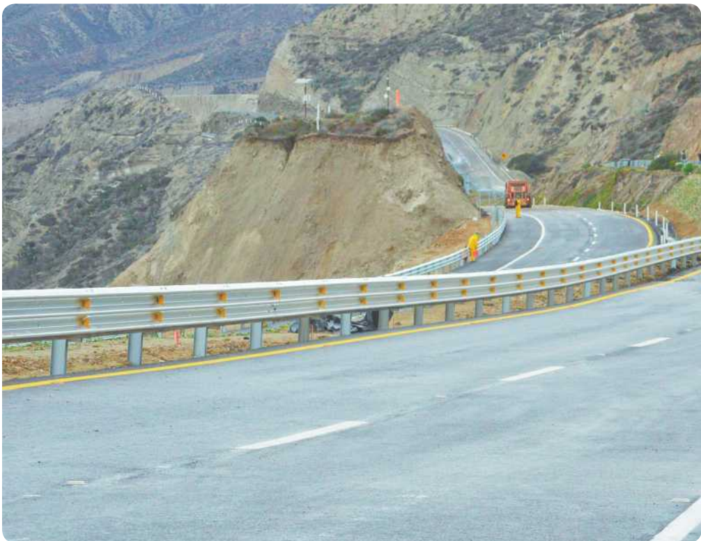
El presidente del organismo empresarial dijo que las autoridades federales atendieron las demandas de los ciudadanos en reparar el tramo colapsado de la carretera de cuota.

riales han sido inmensas, dijo, 15 personas fallecidas y millones de dólares han afectado moral y económicamente a los residentes de toda la región por la falta de flujo comercial y turístico.